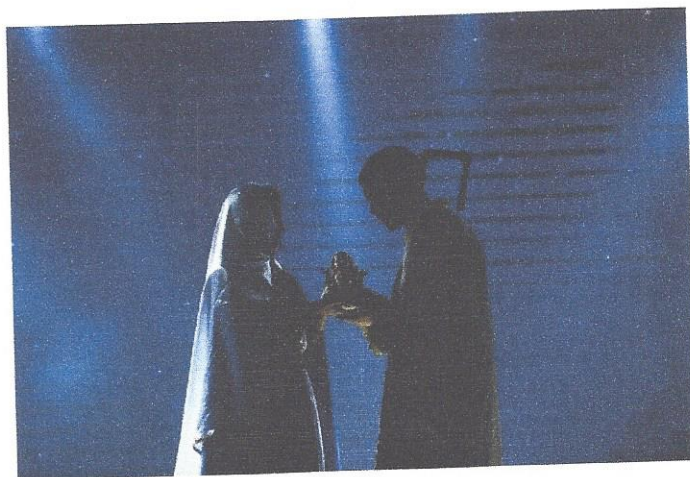
IMAGEM: André Mendes