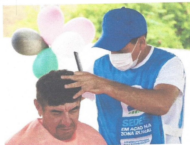
IMAGEM: André Mendes