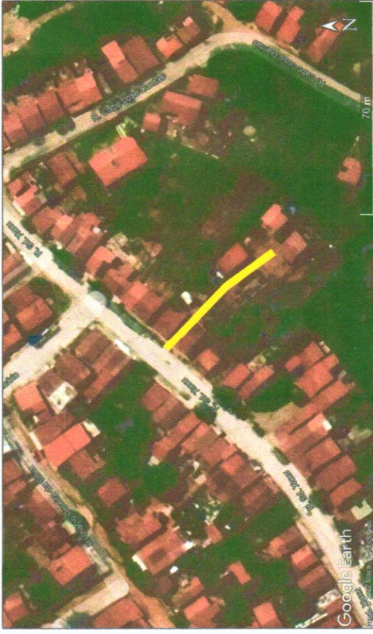
IMAGEM DE SATÉLITE: