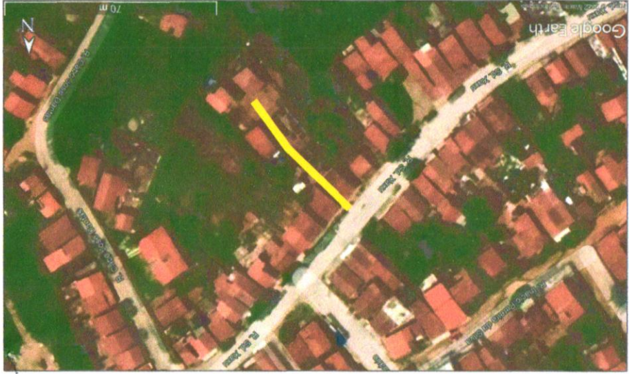
IMAGEM DE SATELITE:

OBSERVAÇÕES: 1. APROVAÇÃO EM RUA NA PLANALTA DA ESCALA PROPOSTA. 2. ENTORNO DA RUA DEBE SER DESEMPENHADO DE ACORDO COM O PROJETO DE ARQUITETURA.