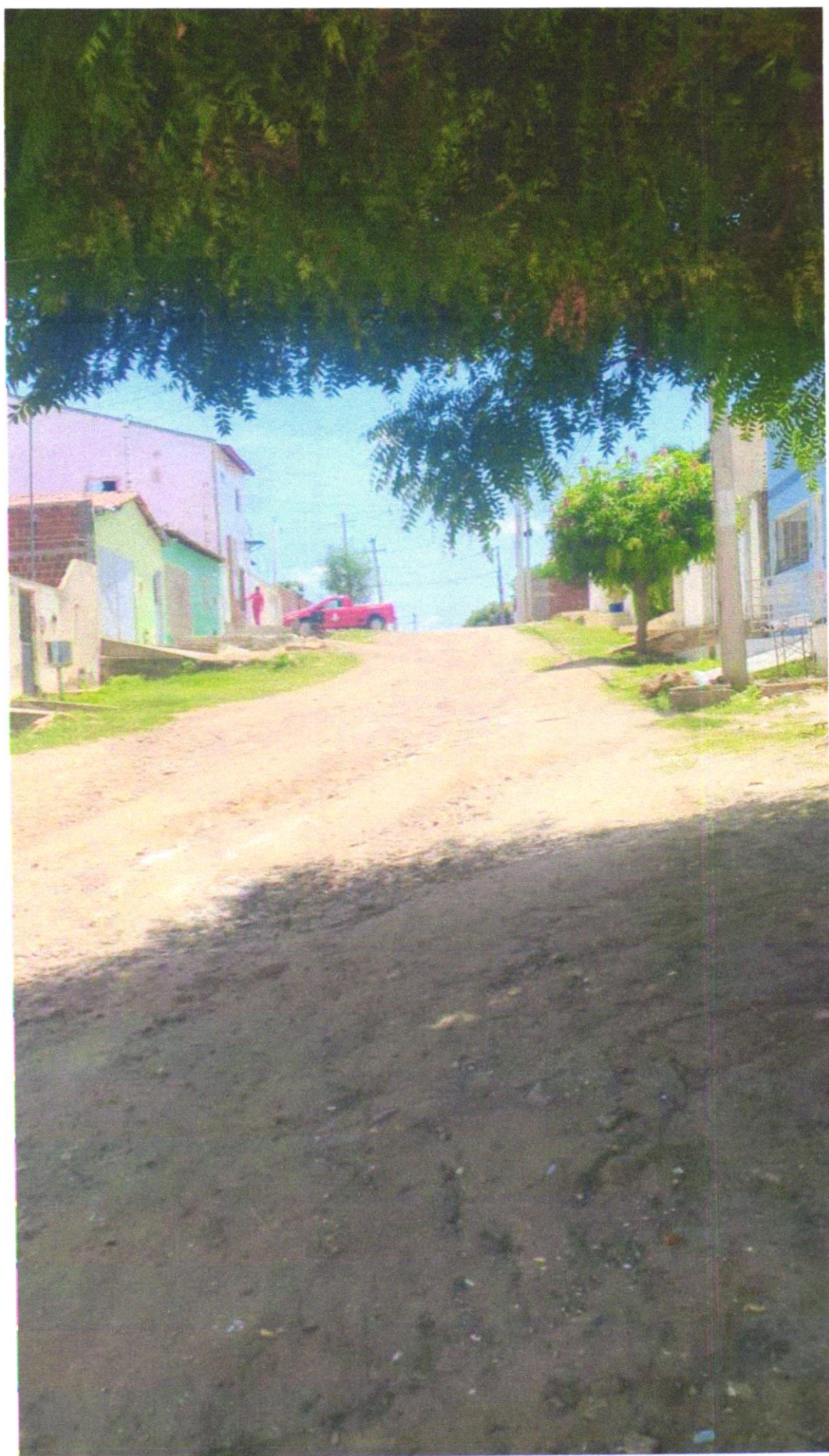
Rua Pedro Velho, 1291, Centro - Telefone: (84) 3351-2904 CEP: 59.900-000 Pau dos Ferros, RN - https://camarapaudosferros.rn.gov.br/